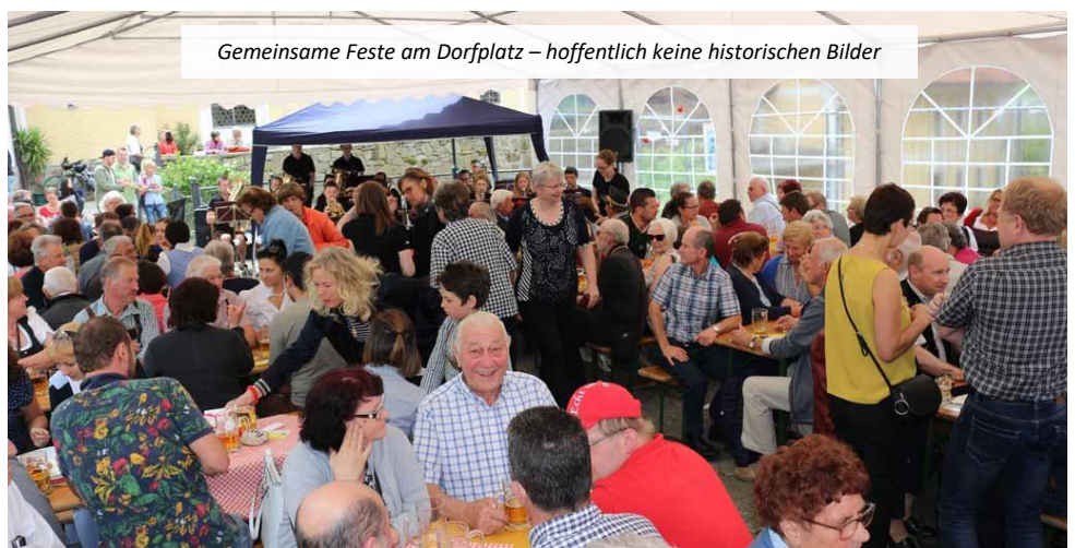
Gemeinsame Feste am Dorfplatz – hoffentlich keine historischen Bilder

Viele gewohnte Routinen wurden in der letzten Zeit über den Haufen geworfen oder eingestellt. Das wöchentliche „in die Musikprobe gehen“, das ganz selbstverständlich Teil unseres Lebens war, gab es plötzlich nicht mehr. Die Zukunft und die Frage „Was darf ich wann wieder machen?“ ist nach wie vor ungewiss. Die Motivation, endlich wieder etwas zu unternehmen, fällt immer öfter dem „Wahrscheinlich geht's eh ned wegen den Bestimmungen“ zum Opfer. Und die Frage des „Warum das alles?“ drängt sich bei manchem Vereinsmitglied auf.