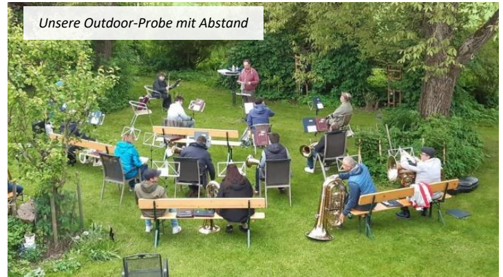
Unsere Outdoor-Probe mit Abstand