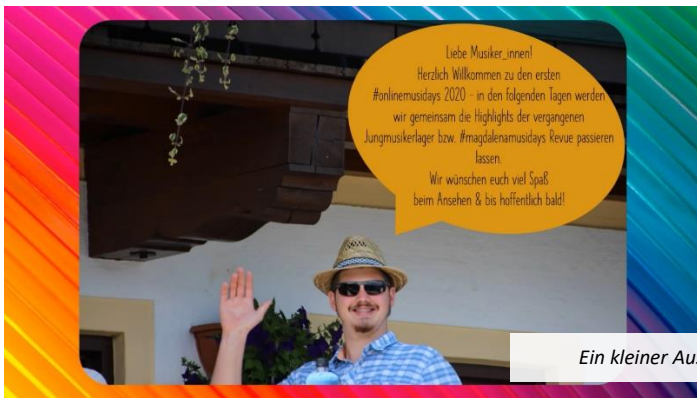
Ein kleiner Auszug aus den Videos

Auf unserer Homepage www.mv-magdalena.at könnt ihr das Video vom 2. Tag sehen! Viel Spaß beim Ansehen und vielleicht bringt es ja auch euch zum Schmunzeln!