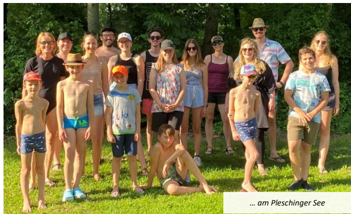
... am Pleschinger See

Am Mittwoch starteten wir mit einem gemeinsamen Nachmittag am Pleschinger See. Die Mutigen unter uns hüpfen gleich zu Beginn in den See. Ein paar blieben an Land, ein Eis bekam später aber trotzdem jeder. Danach hieß es brainstormen. Denn in drei Gruppen sollte je eine Podcast-Folge aufgenommen werden. Neben Musi-Themen, Gesprächen über Eissorten und die Wasserqualität des Pleschinger Sees, wurden sogar äußerst kreative Werbeeinschaltungen und kurze Interviews mit unseren Jungen eingebaut. Nach einem abschließenden Volleyball-Match war der erste Tag dann schon wieder zu Ende.