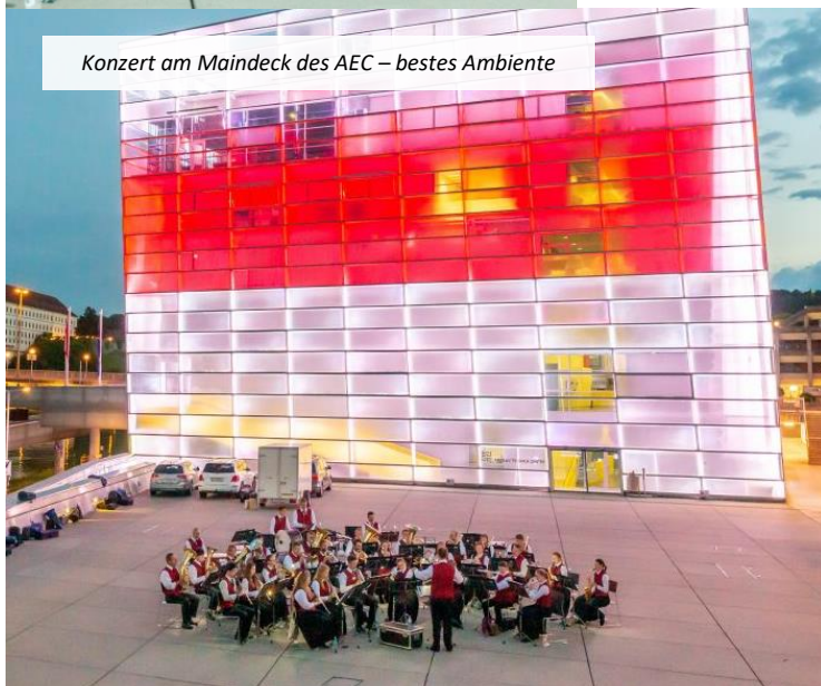
Konzert am Maindeck des AEC – bestes Ambiente